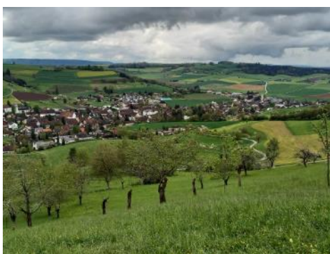
Blick vom Stauffebärg Schleithem