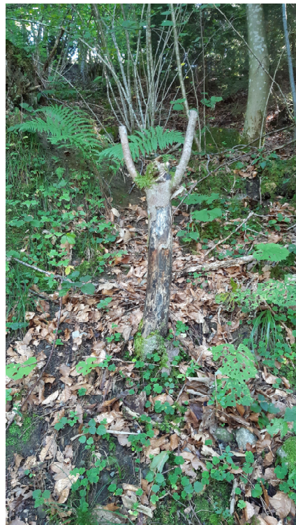
Ein Männlein steht im Walde....