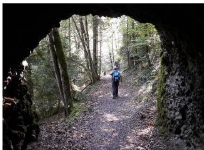
Wanderweg an der Sihl

Das Oetwiler Wanderleiterteam freut sich auf Eure Anmeldung und wünscht eine erholsame und beglückende Wanderung!